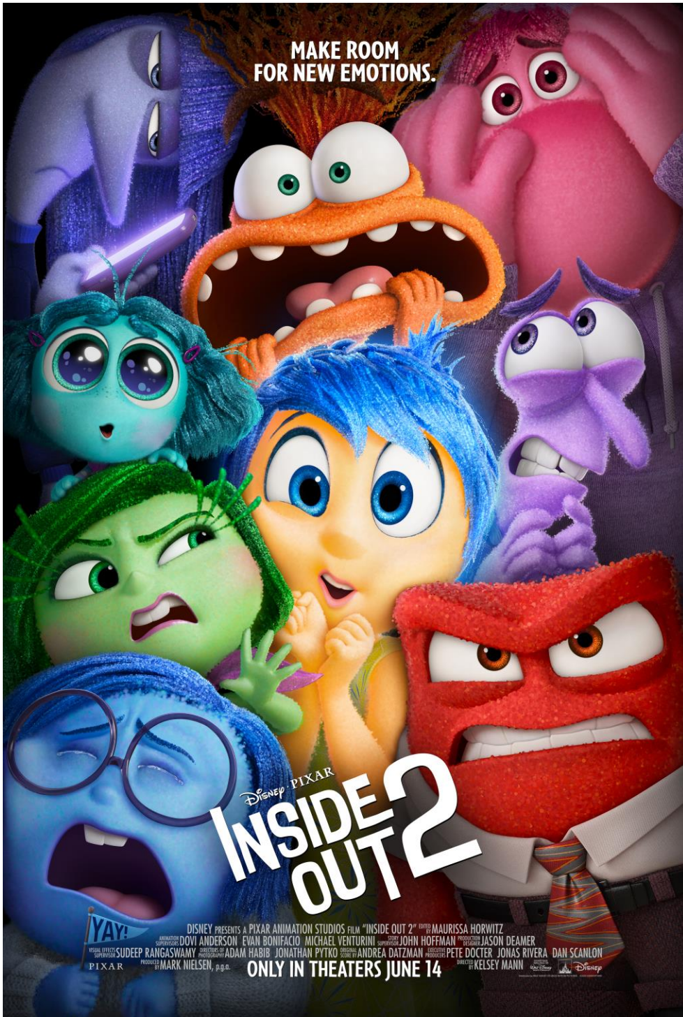
Affiche du film Vice Versa 2 – Sortie prévue le 19 juin aux Etats-Unis