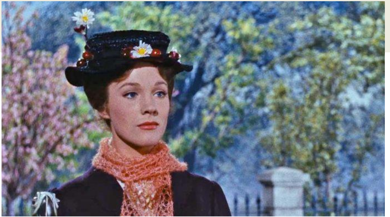
Julie Andrews incarne Mary Poppins dans le film de 1964