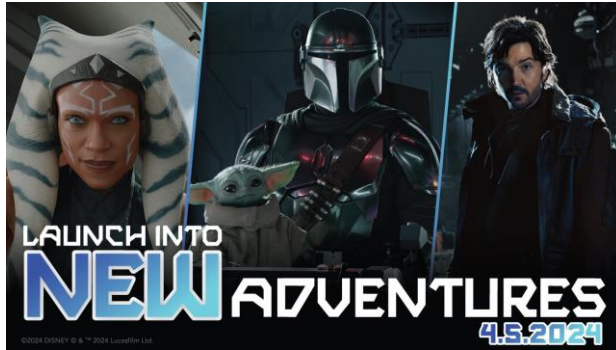
Ahsoka, Andor et The Mandalorian... de nouvelles aventures pour Star Tours

Au menu, les fameux pilons de dinde sauce BBQ et les indispensables churros