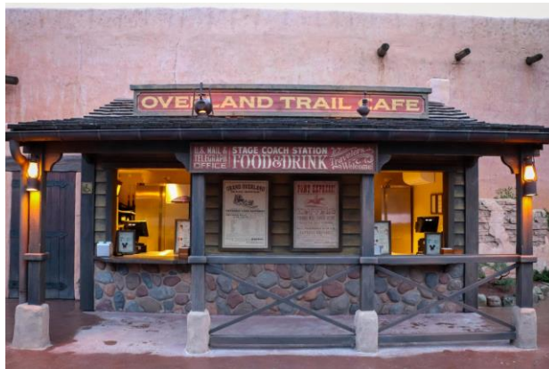
La façade du Overland Trail Café, nouveau point de restauration à Frontierland