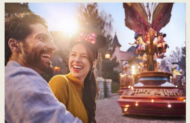
Disney Stars on Parade ou Disney Dreams !

Pour profiter au mieux de ces spectacles, Disneyland Paris proposera, dès le 28 mars Le 28 mars, Disneyland Paris lancera une nouvelle zone réservée en extérieur. Cette zone dédiée assurera aux visiteurs une vue imprenable et garantie sur les spectacles extérieurs les plus populaires. Ce nouveau service sera, bien sûr, accessible via l'application mobile Disneyland Paris en quantité limitée pour un tarif unique est de 19€ par spectacle.